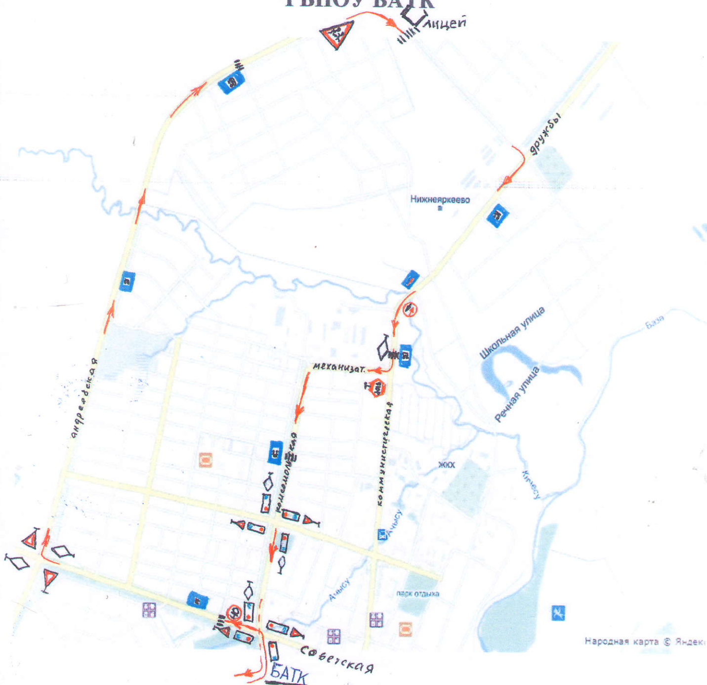
СХЕМА УЧЕБНОГО МАРШРУТА № 5 ГБПОУ БАТК