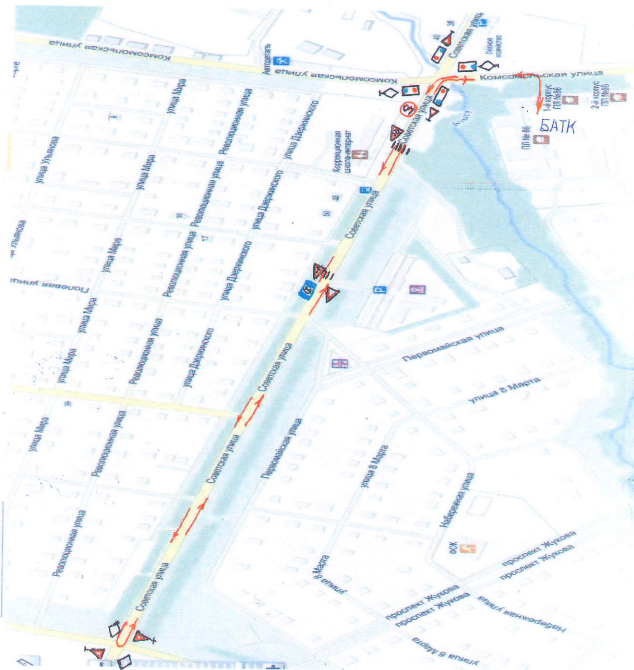
СХЕМА УЧЕБНОГО МАРШРУТА № 1 ГБОУ БАТК