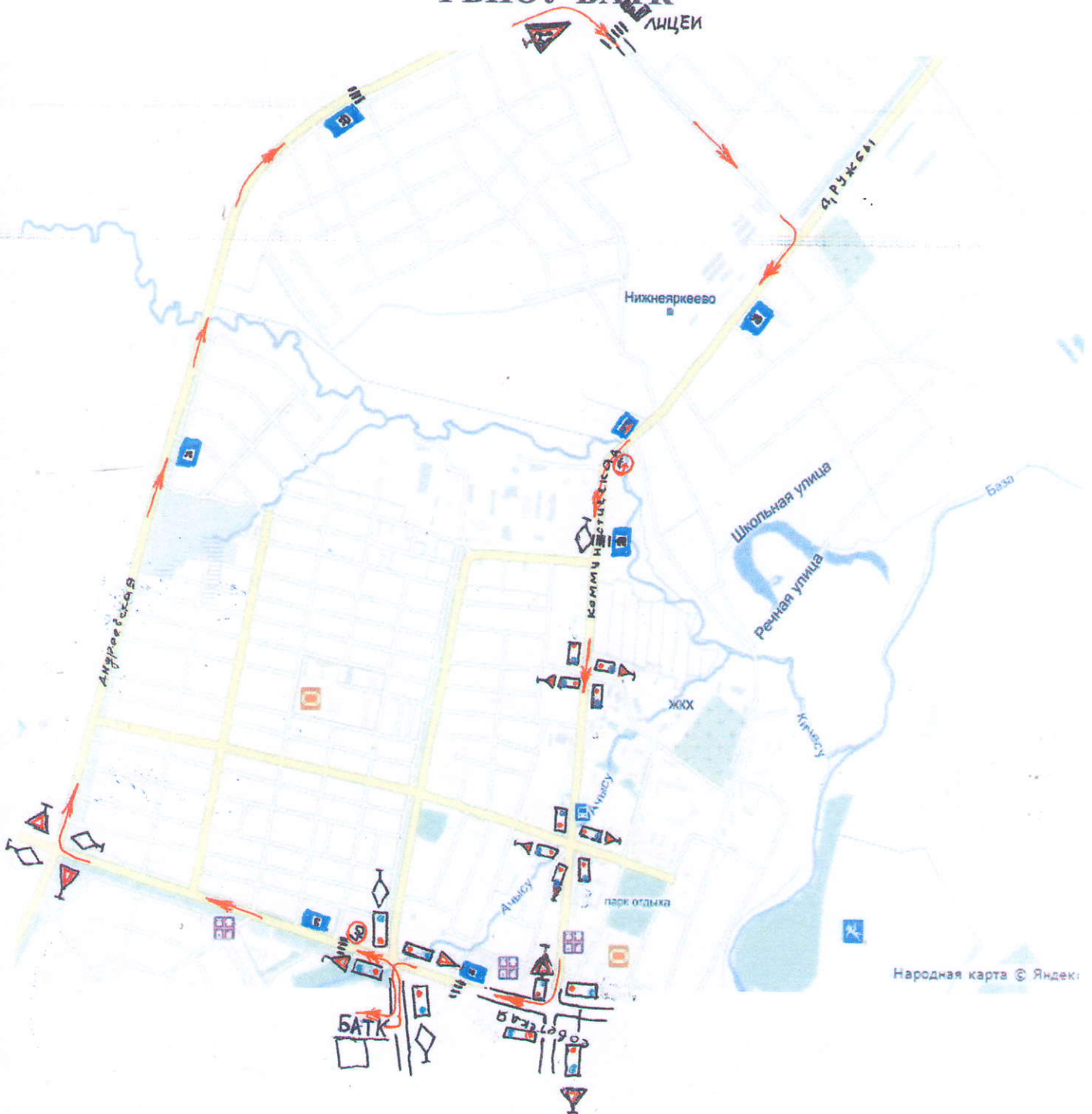
СХЕМА УЧЕБНОГО МАРШРУТА № 3 ГБПОУ БАТК